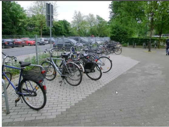
Neue Abstellanlagen der Kreisberufsschule im westlichen Teil des Schulgeländes