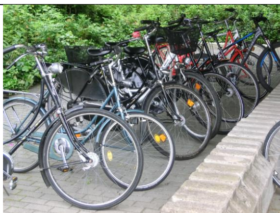
Benutzer meiden die angebotenen Ständer