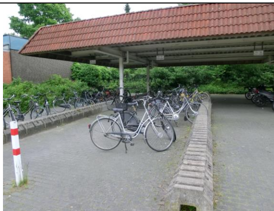
Vorhandene überdachte Abstellanlage