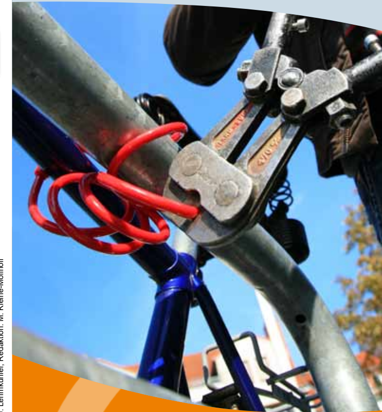
Stand: 2013-07 Redaktion: M. Kleine-Möllhoff