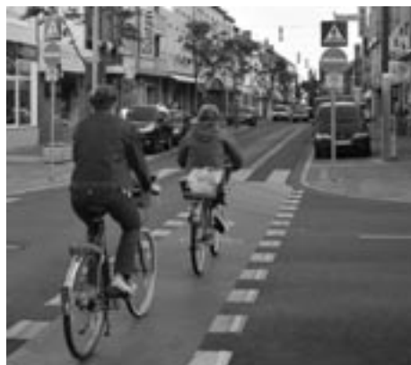
Kaiserstraße / Würselen