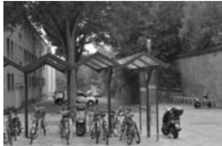
Bahnhofsvorplatz Rothe Erde

Gerade an den beiden Plätzen, die sich unmittelbar an der Bahnhofsmauer befinden, dürfte der Aufwand, dort ein Dach über den Fahrradbügel anzubringen, nicht allzu groß sein. Die fehlende Überdachung führt dazu, dass viele Radfahrer weiterhin ihr Rad im Fußgängertunnel des Bahnhofs am Gelände anschließen, wie sie es sich während der Umbauphase, als es plötzlich gar keine Fahrradständer mehr gab, angewöhnt haben.