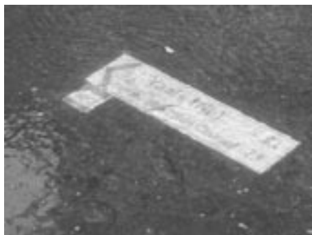
Schilder an und in der Wurm

nenstadt und nach Vaals zeigen soll, weist jetzt nach Haaren und Würselen. Und bereits zweimal habe ich Schilder, die eigentlich den Radfahrern den Weg weisen sollen, auf dem Grund der Wurm liegen sehen. Was sind das nur für Menschen, die solche Einrichtungen, die der Allgemeinheit gehören, mutwillig zerstören.